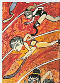
第62回ふれあい運動会 ポスター採用作品